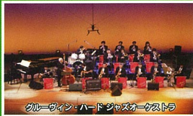
ブルーザイン・ハード ジャズオーケストラ

※ドリンク食事券付(200円) *小雨決行、荒天の場合は西部市民サービスセンター(多目的ホール)に会場を変え実施します。*払い戻しはご容赦願います。