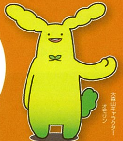
大森山動物園 まりん