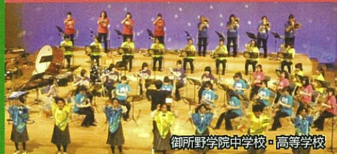
御所野学院中学校・高等学校

8店舗のグルメとほろ酔いビール! シャトルバス(無料運行) 秋田市 エリアなかいちとグリーン広場を往復運行 10:00~21:30(詳細は大森山動物園 HP にて)