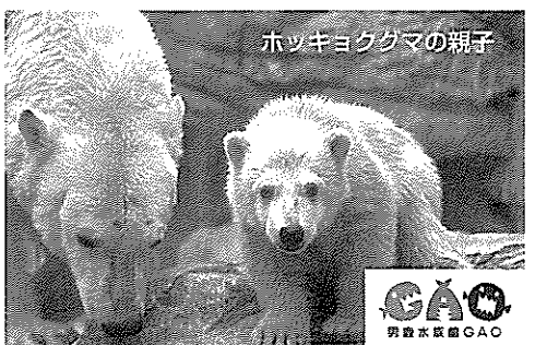
ホッキョクグマの親子